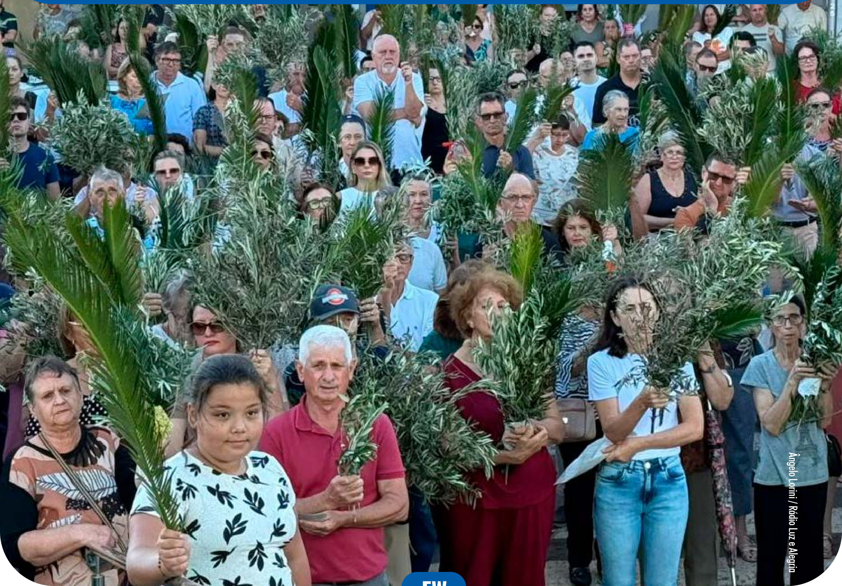
Ângelo Lorini / Rádio Luz e Alegria