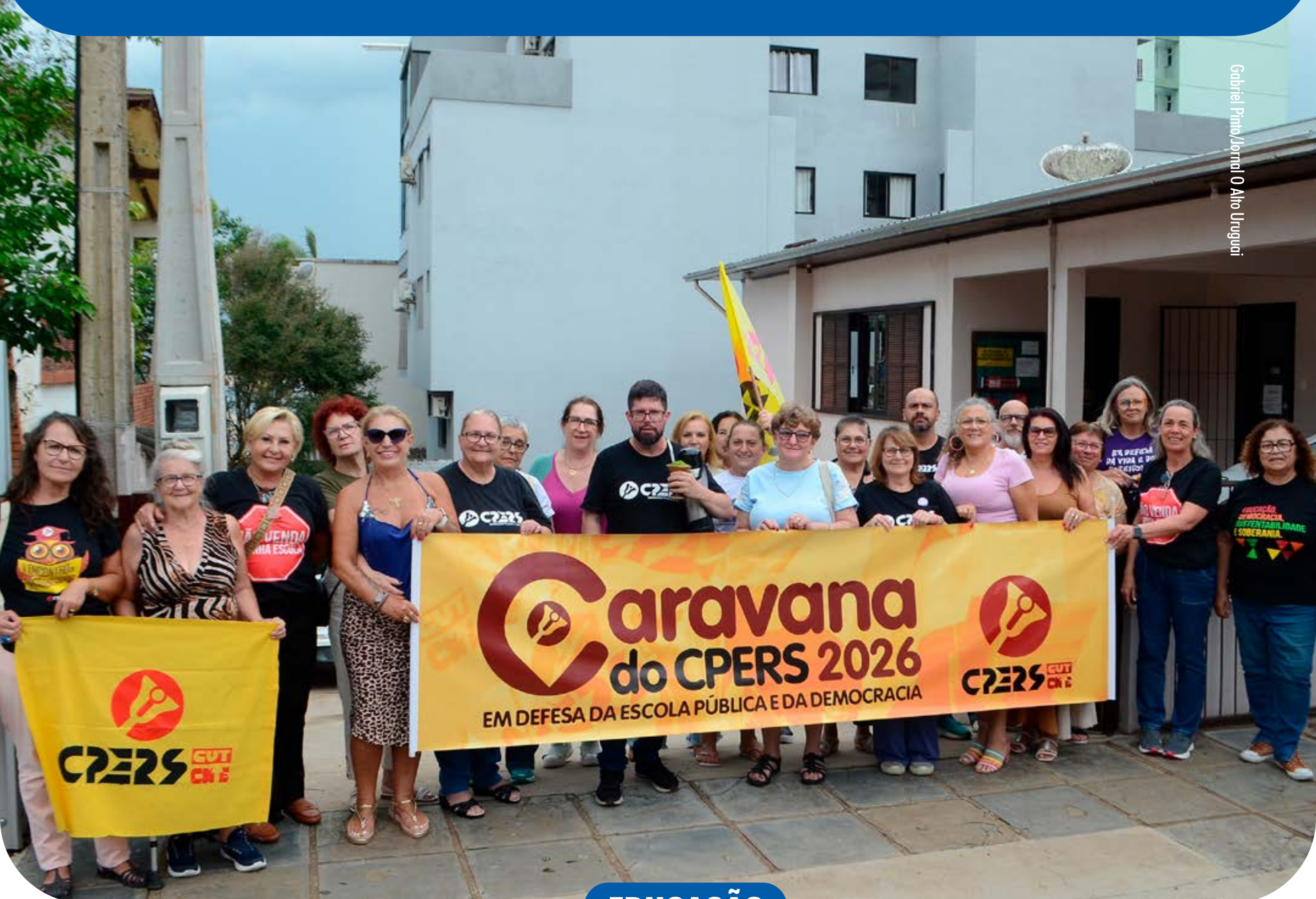
Gabriel Pinto/Jornal O Alto Uruguai