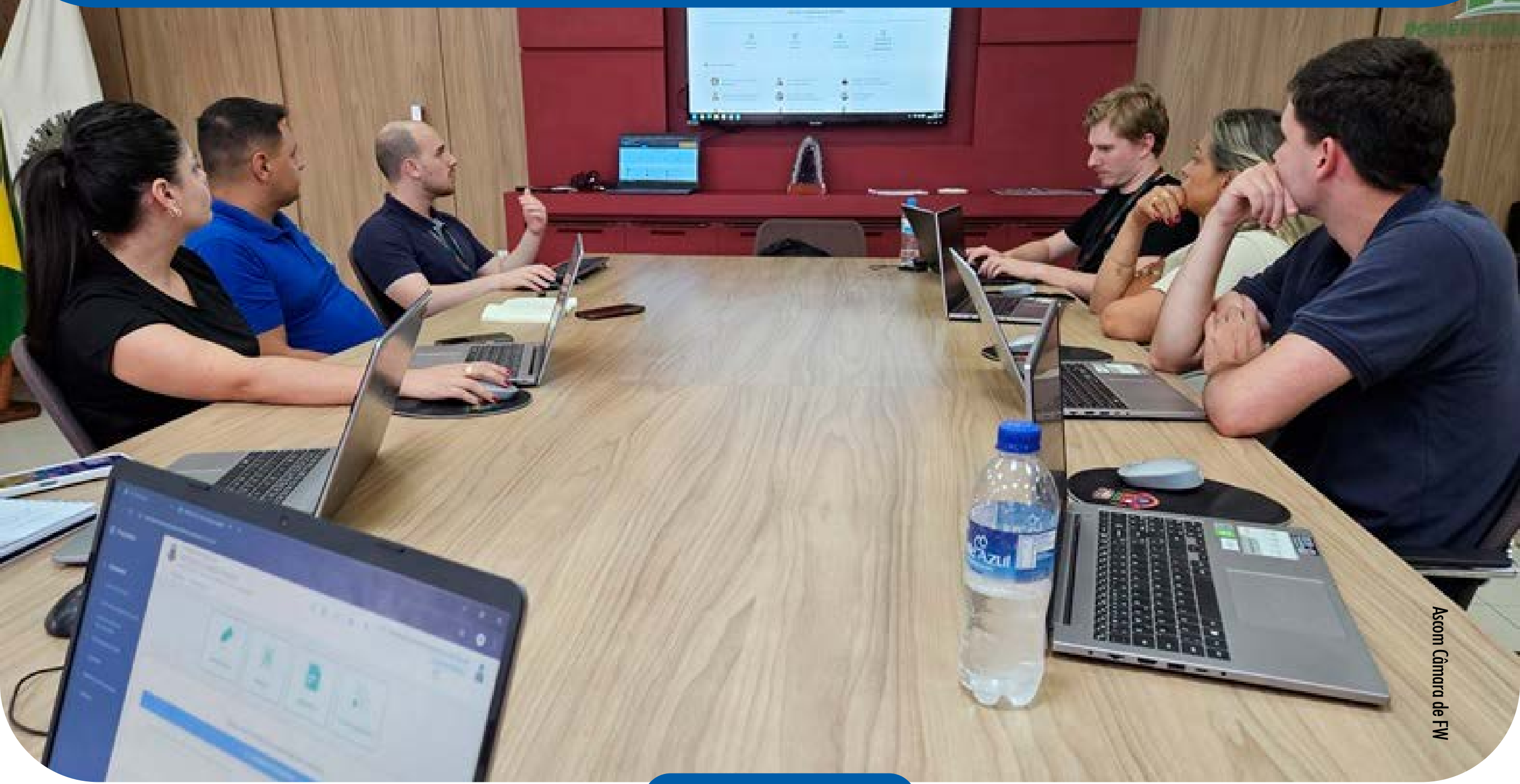
Asscom Câmara de FW