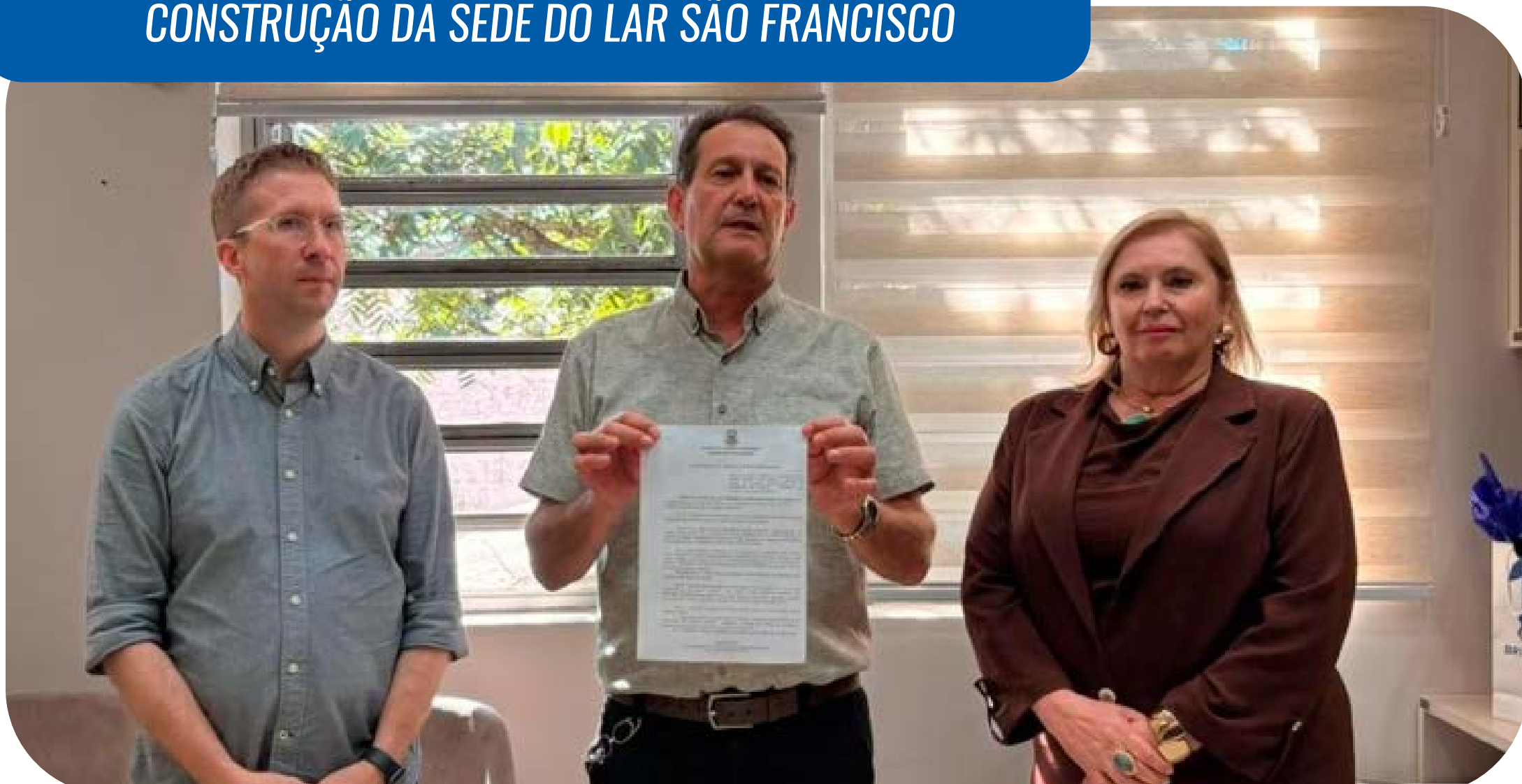
Asscom Prefeitura FW

ENTENDA: PREFEITURA DE FW DOA TERRENO PARA A CONSTRUÇÃO DA SEDE DO LAR SÃO FRANCISCO