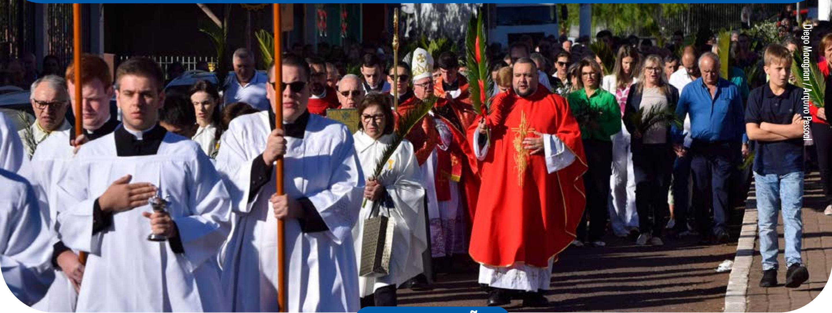
Diego Macagnan / Arquivo Passoi