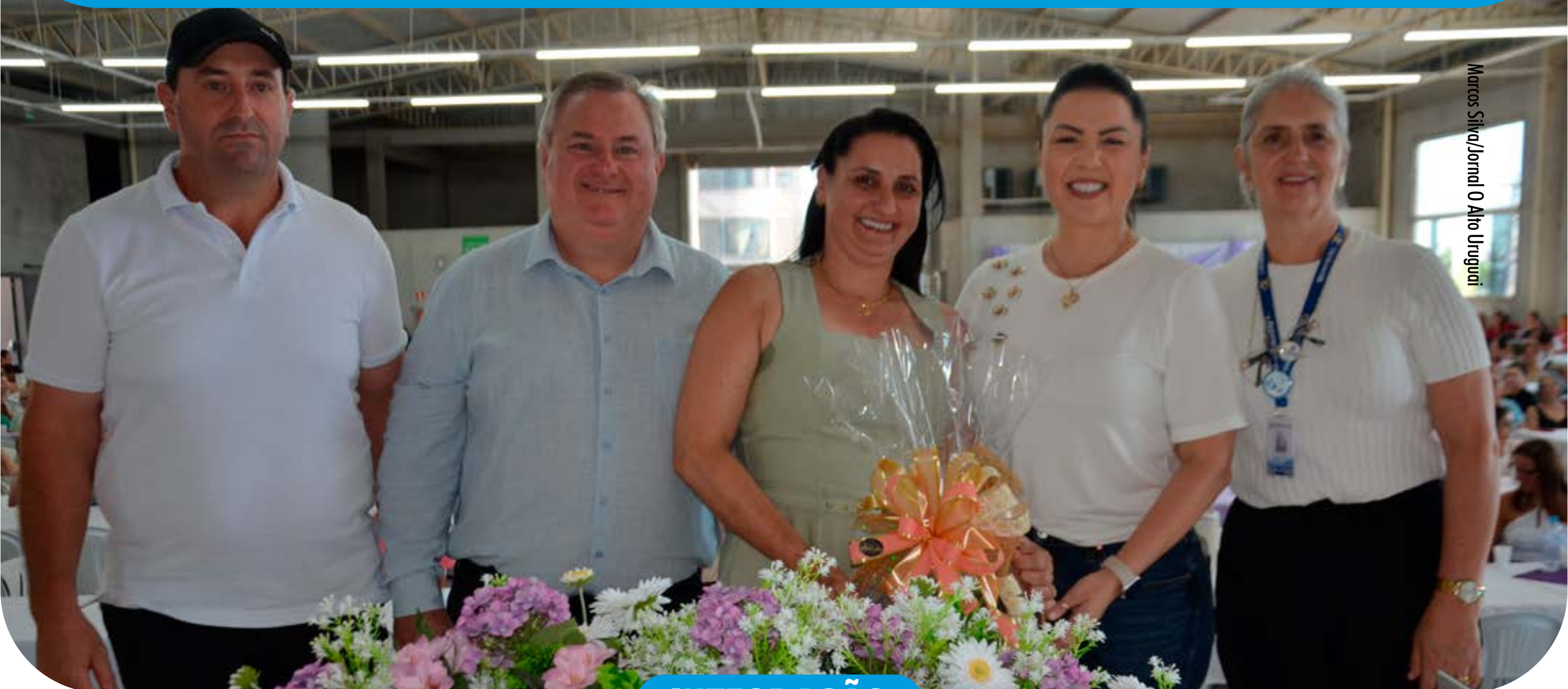
Marcos Silva/Jornal O Alto Uruguai