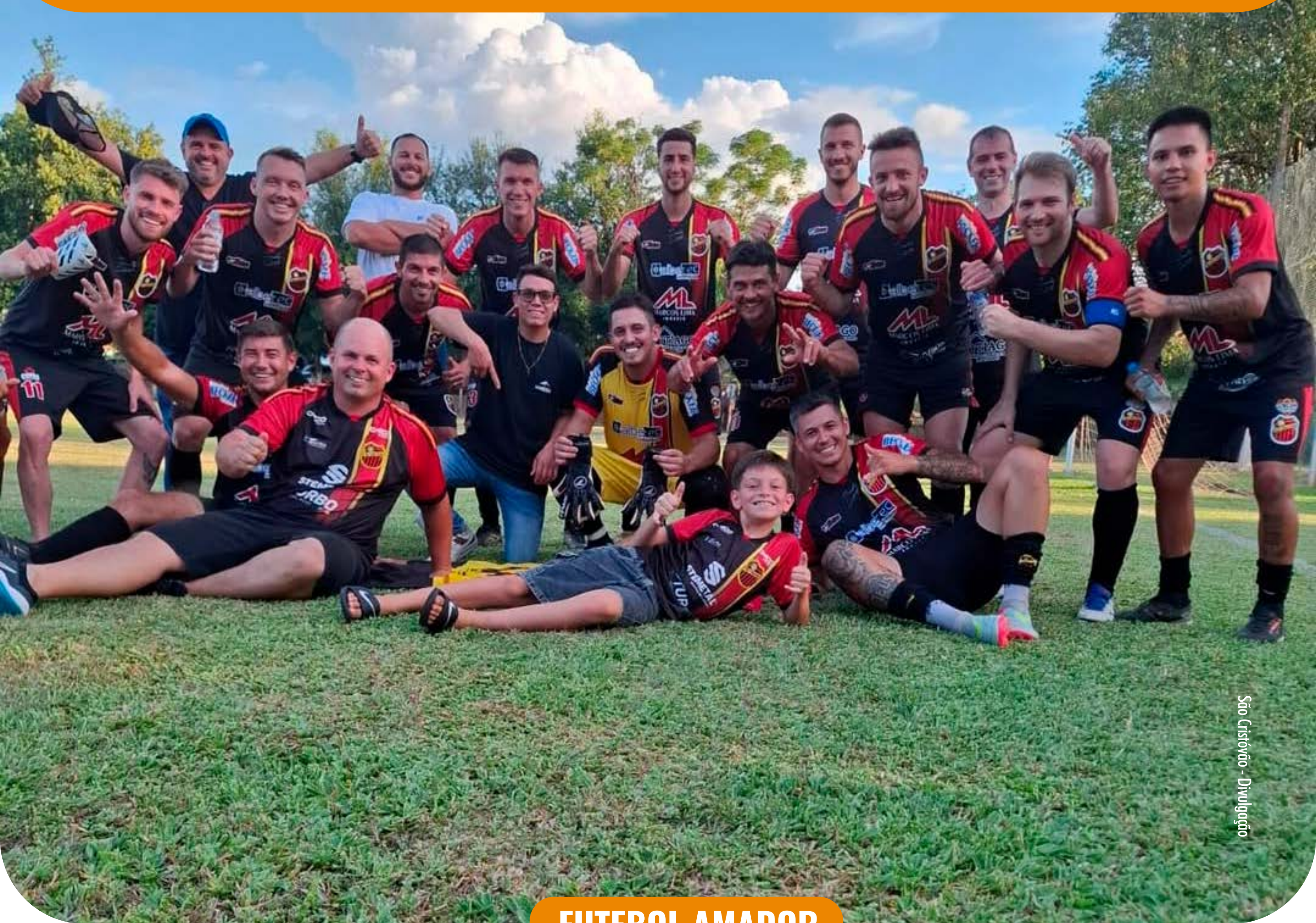
São Cristóvão