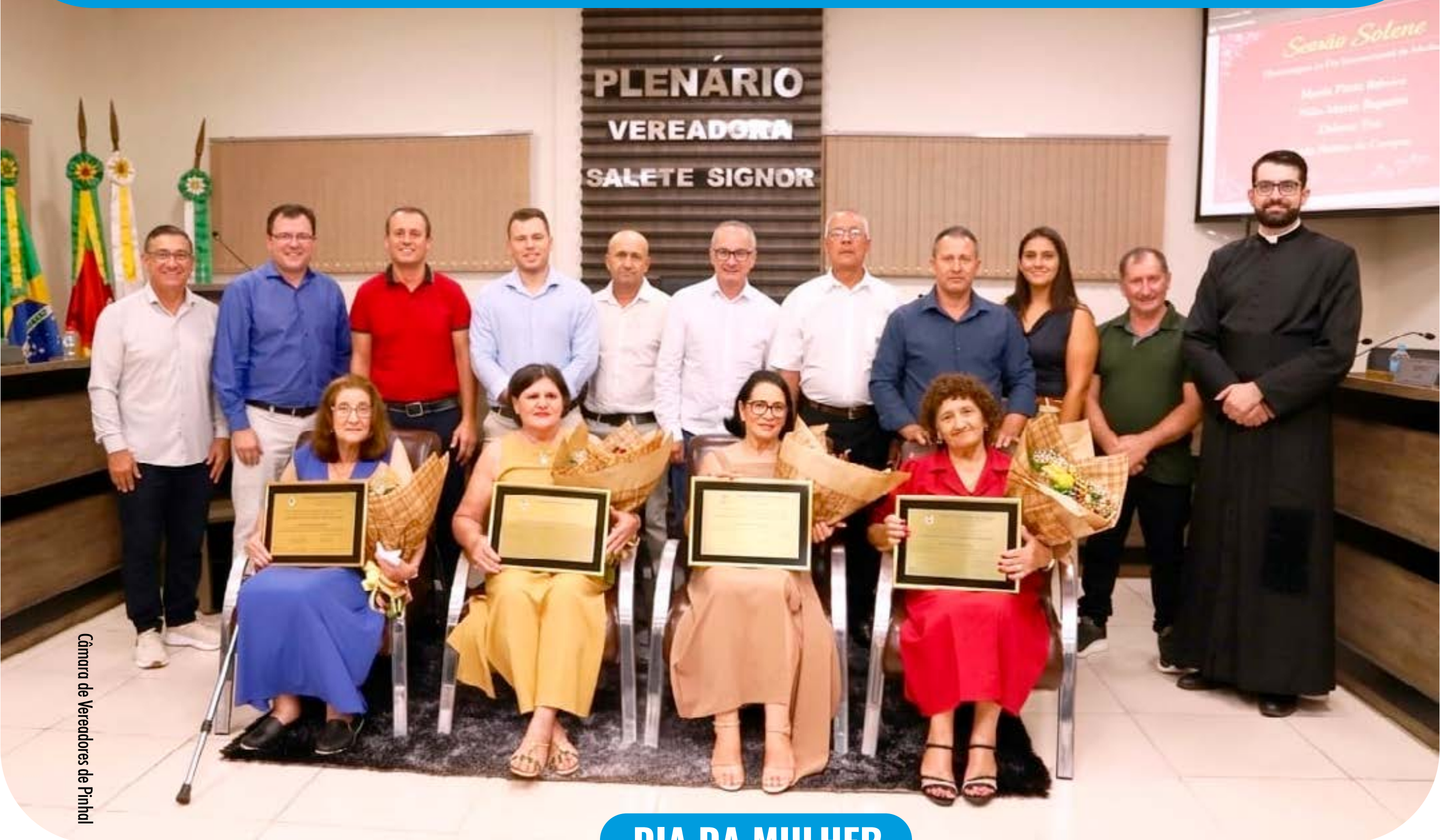
Câmara de Vereadores de Pinhal