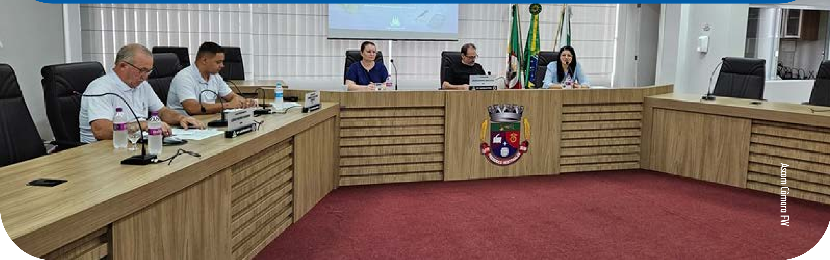
Assom Câmara FM

neração dos profissionais do magistério atingiu R$ 20.630.053,69, equivalente a 81,40% dos recursos do fundo, superando o mínimo exigido de 70%.