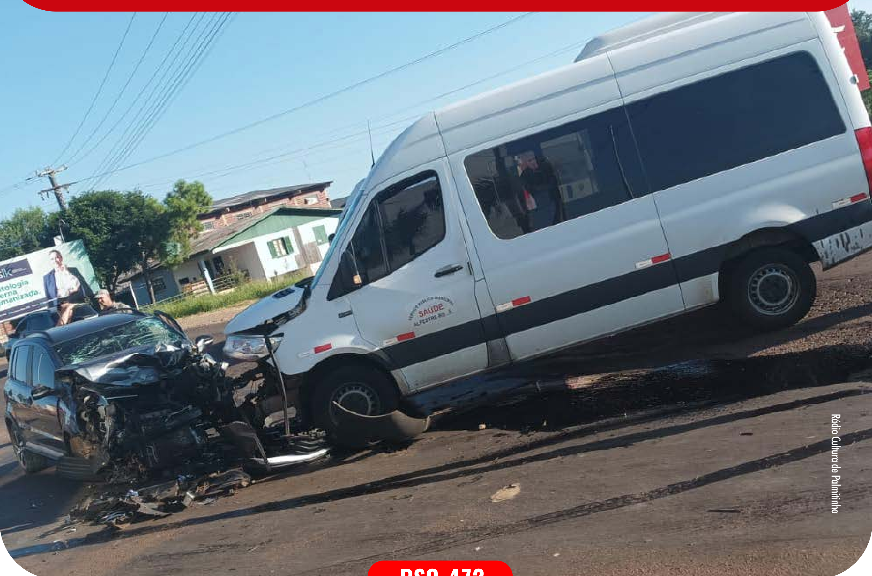
Rádio Cultura de Palmitinho