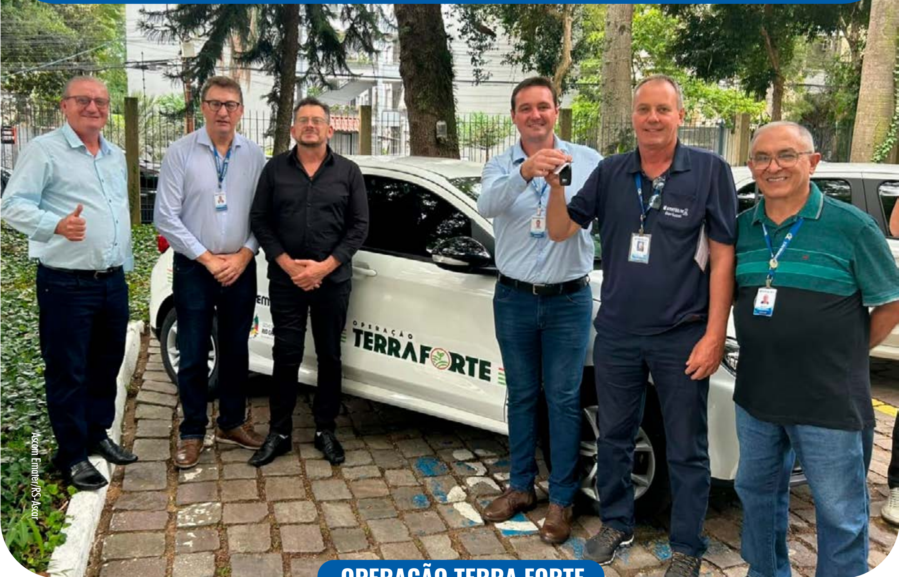
OPERAÇÃO TERRA FORTE