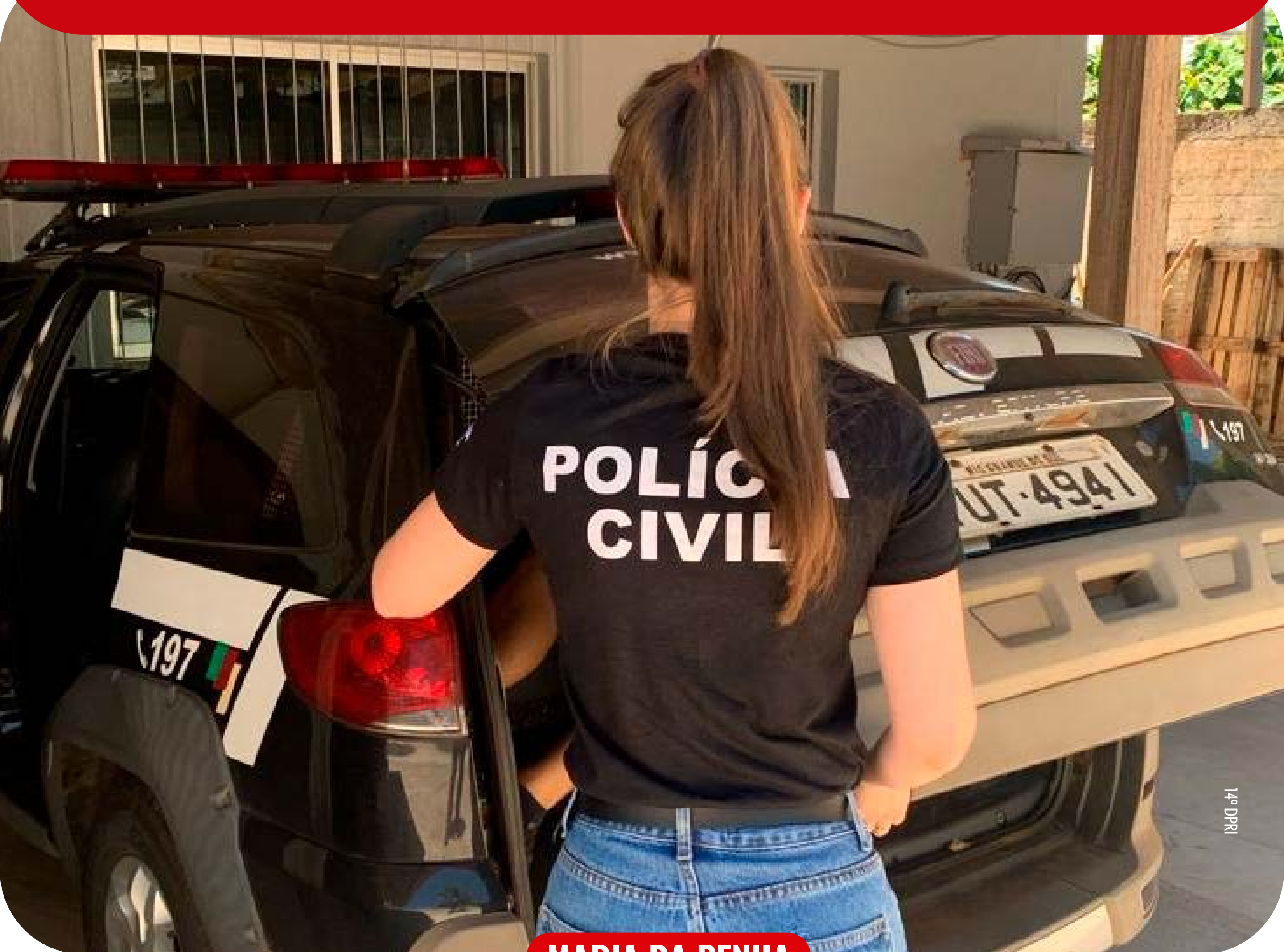
MARIA DA PENHA