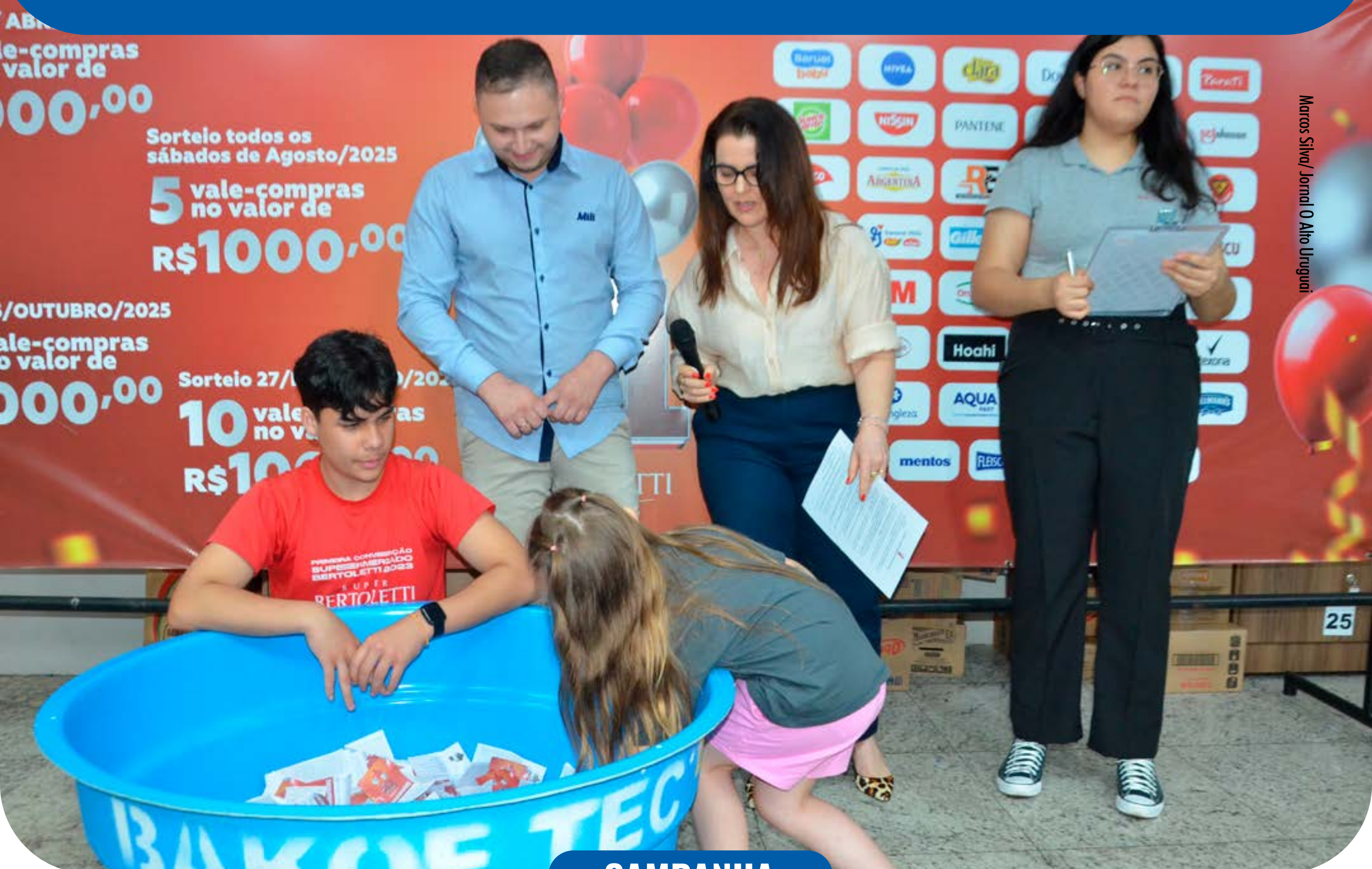
Marcos Silva/ Jornal O Alto Uruguai