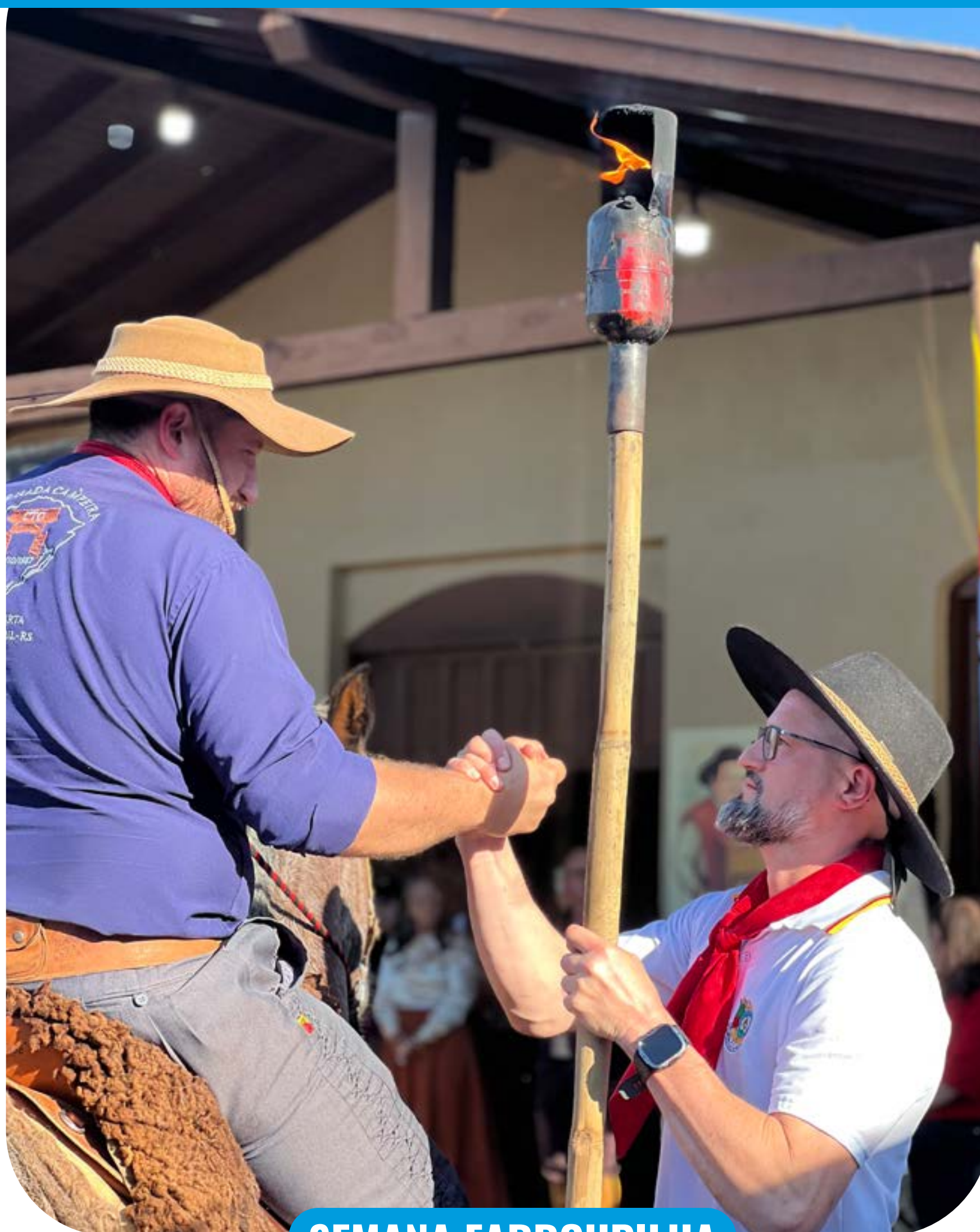
Ascom Taquaruçu do Sul