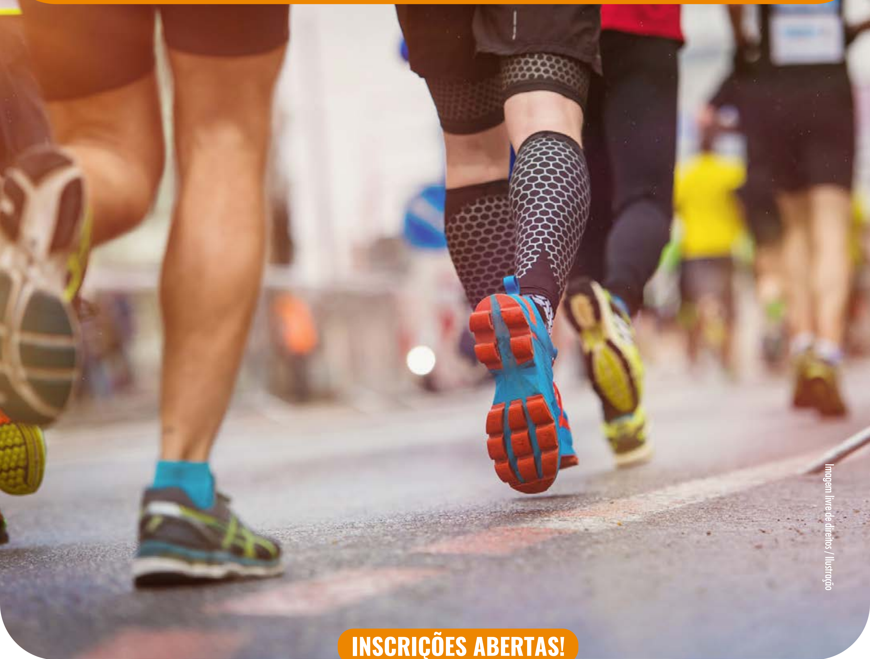
Imagem livre de direitos / Ilustração