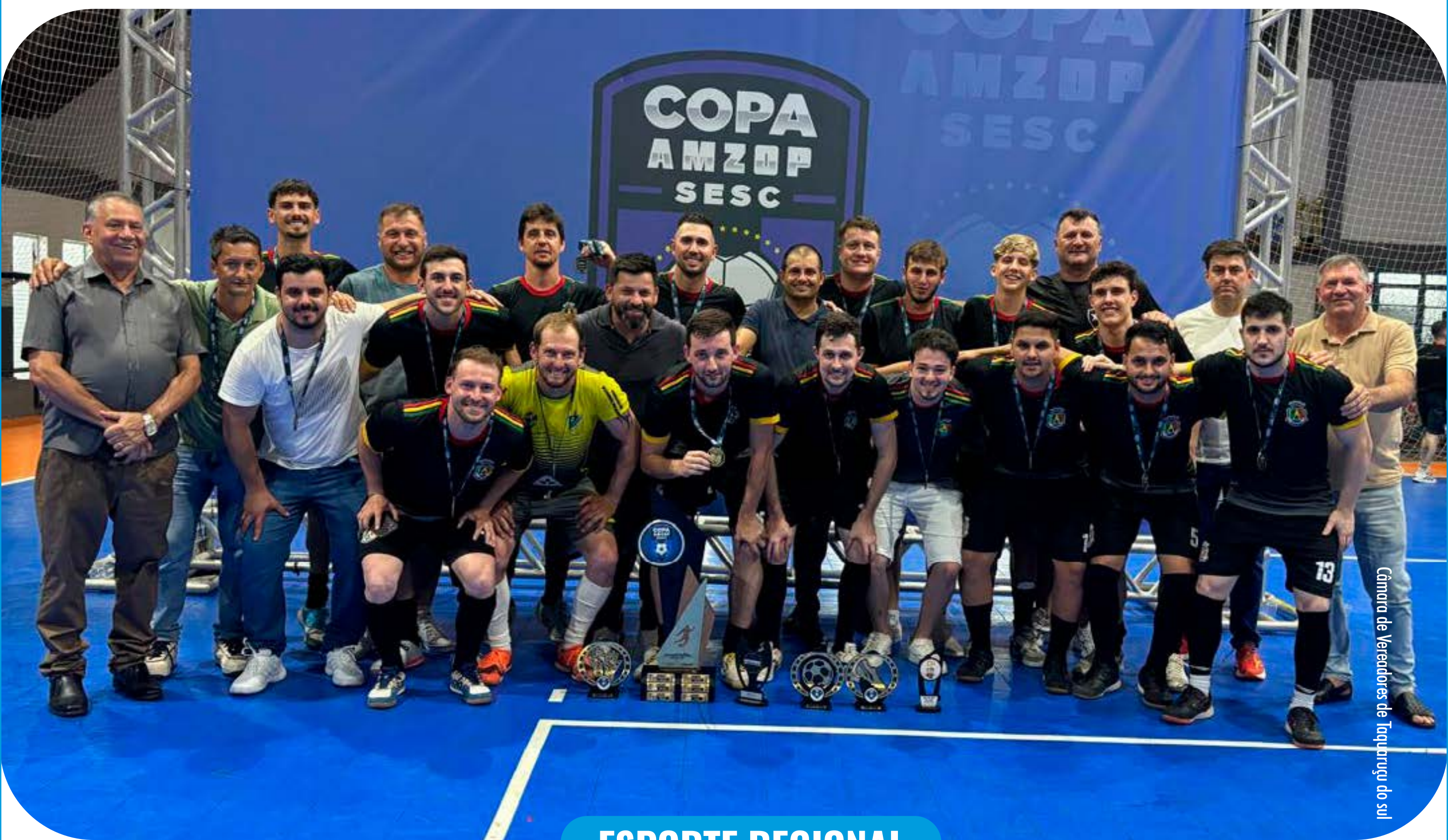
Câmara de Vereadores de Taquaruçu do sul