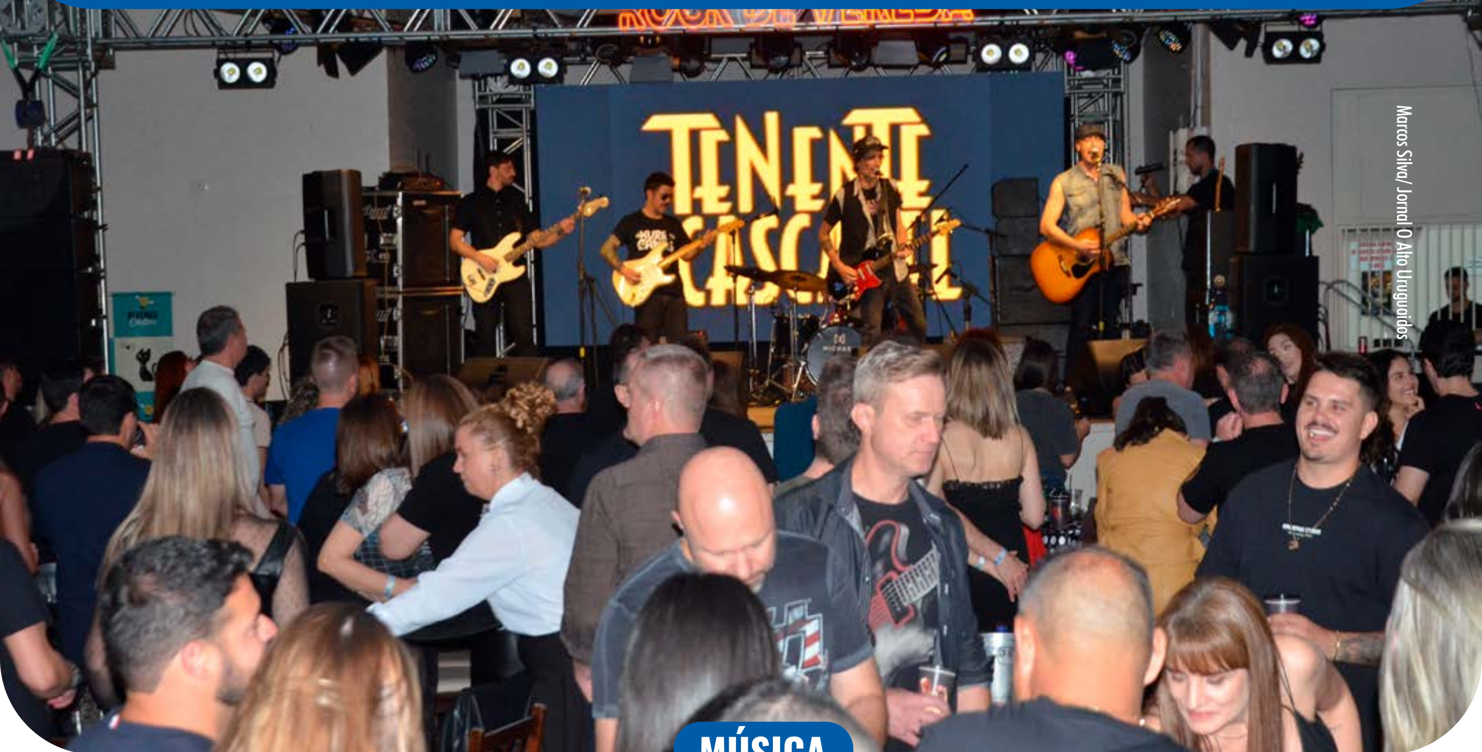
Marcos Silva / Jornal O Alto Uruguaios