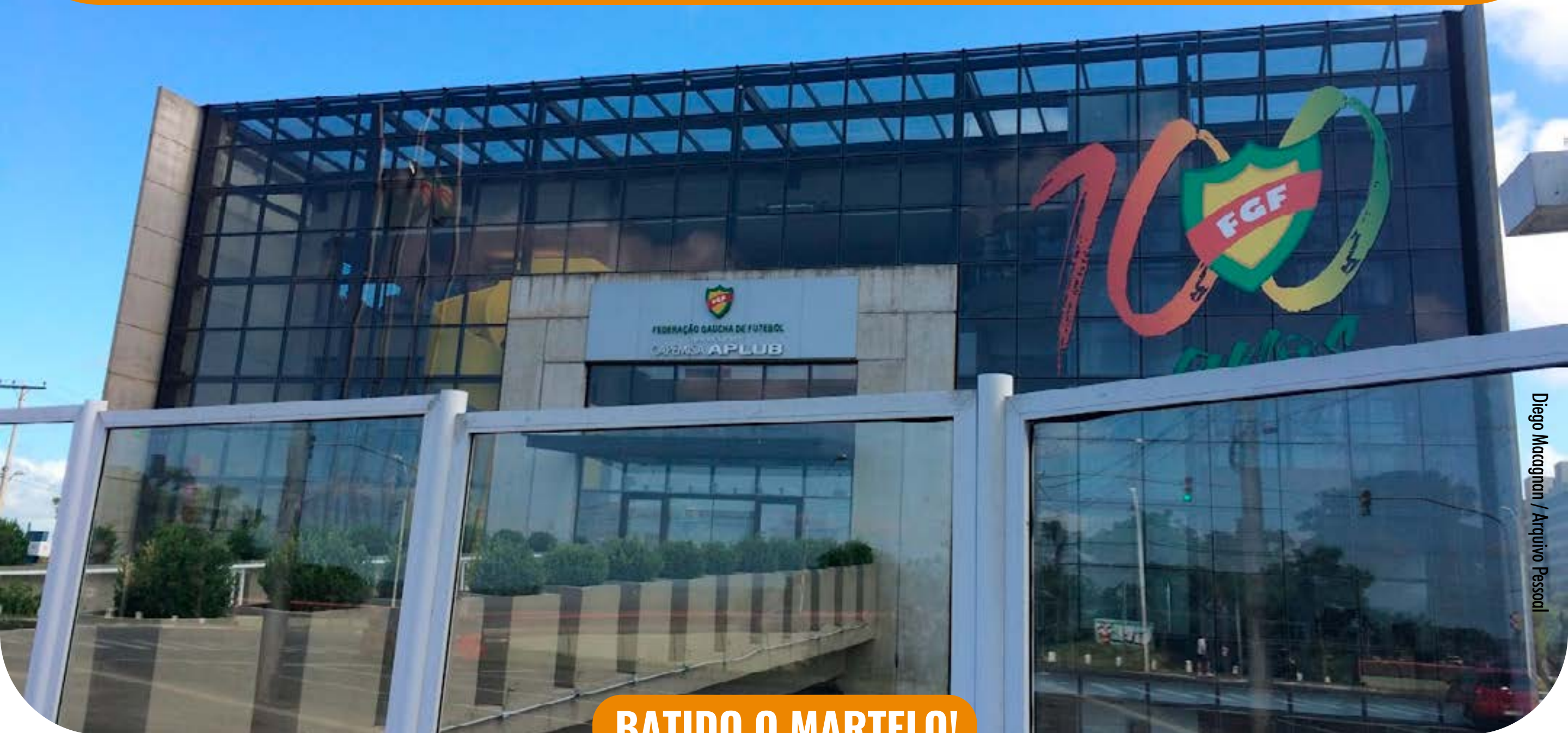
Diego Macagnan / Arquivo Pessoal