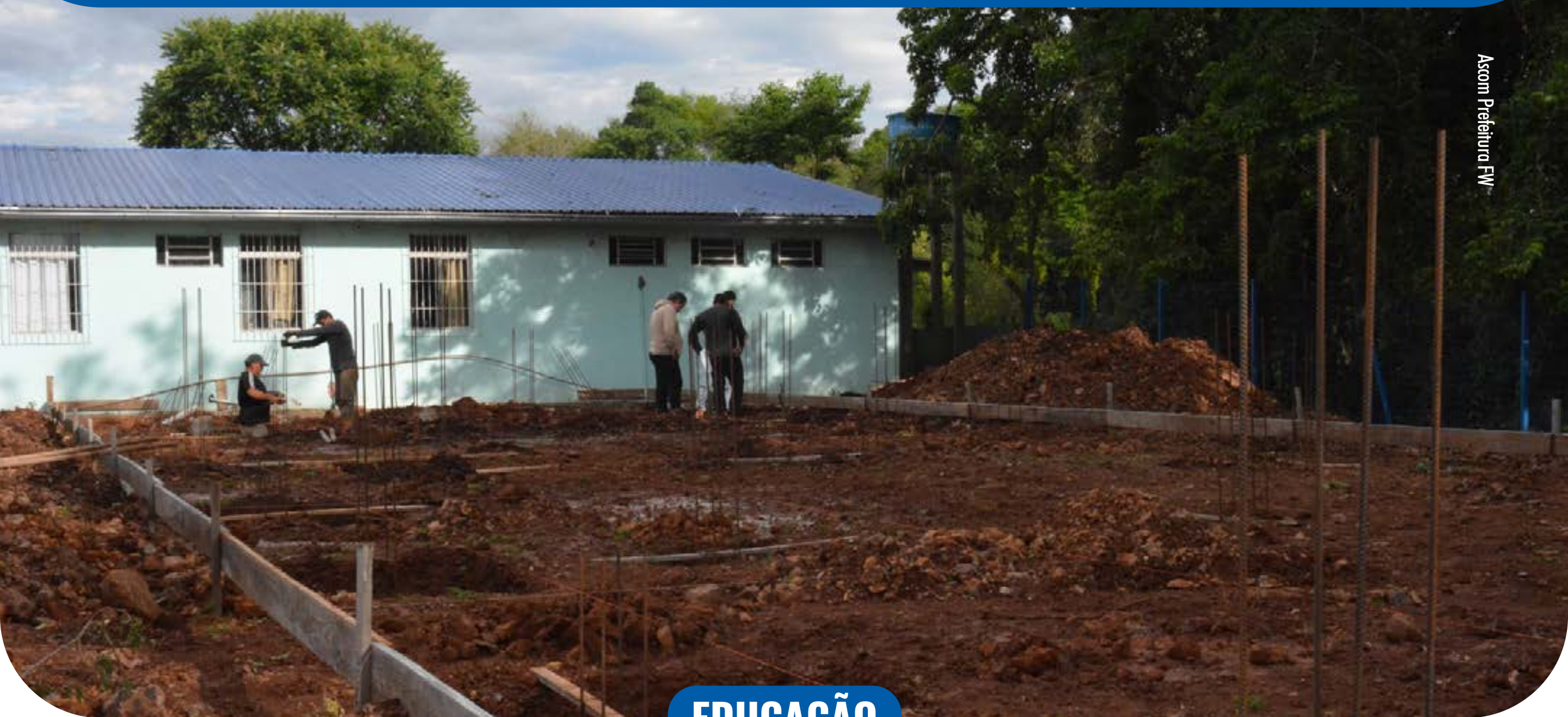
Ascom Prefeitura FW