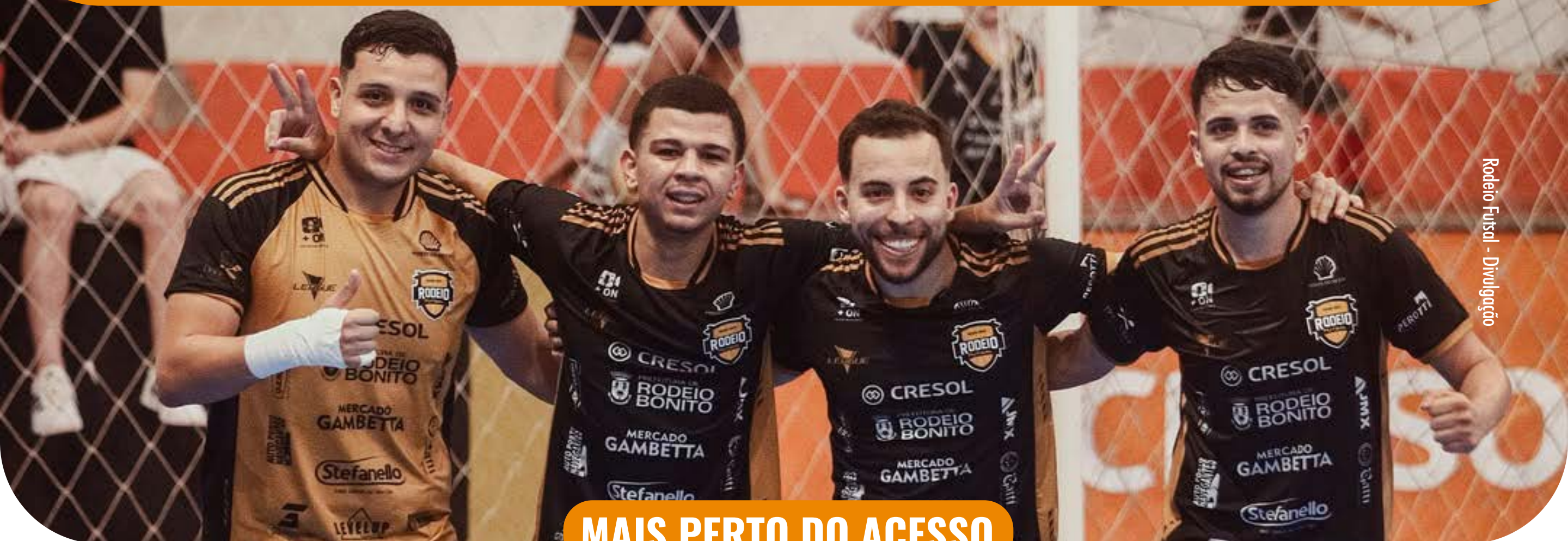
Rodeio Futsal