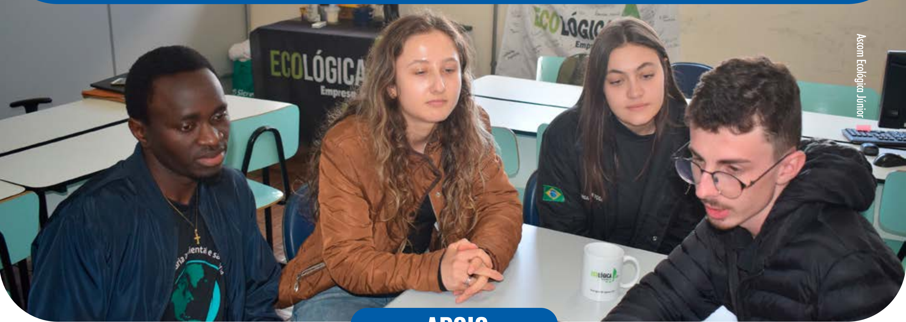
Ascom Ecológica Júnior