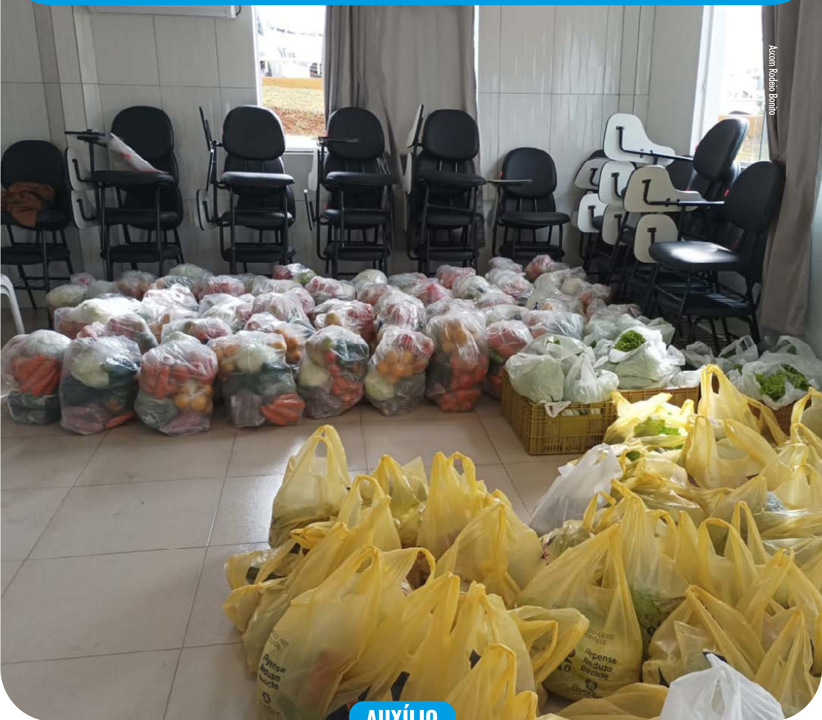
Ascom Rodeio Bonito