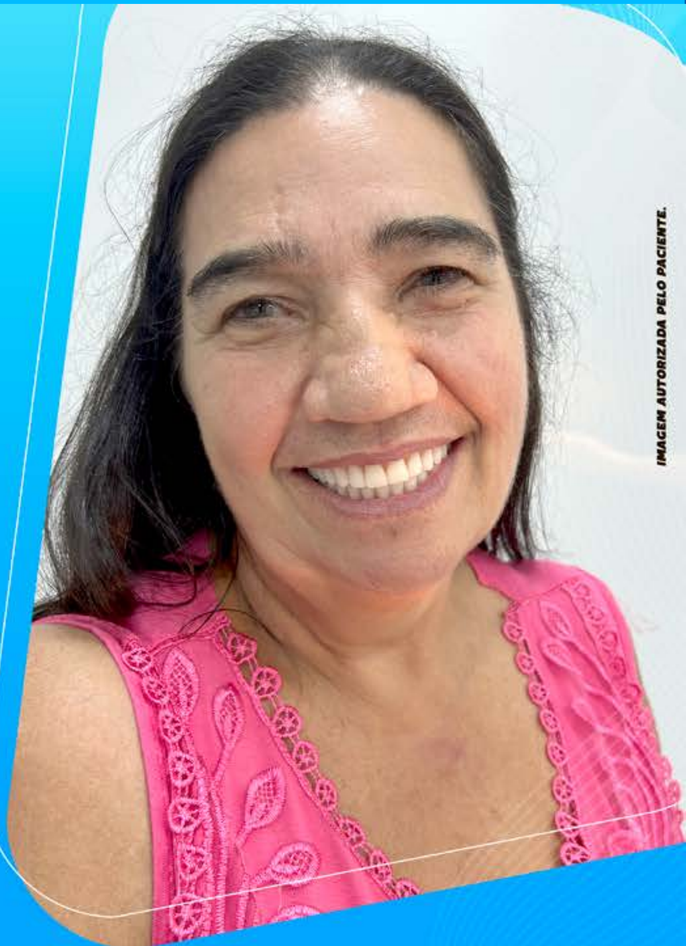
IMAGEM AUTORIZADA PELO PACIENTE.