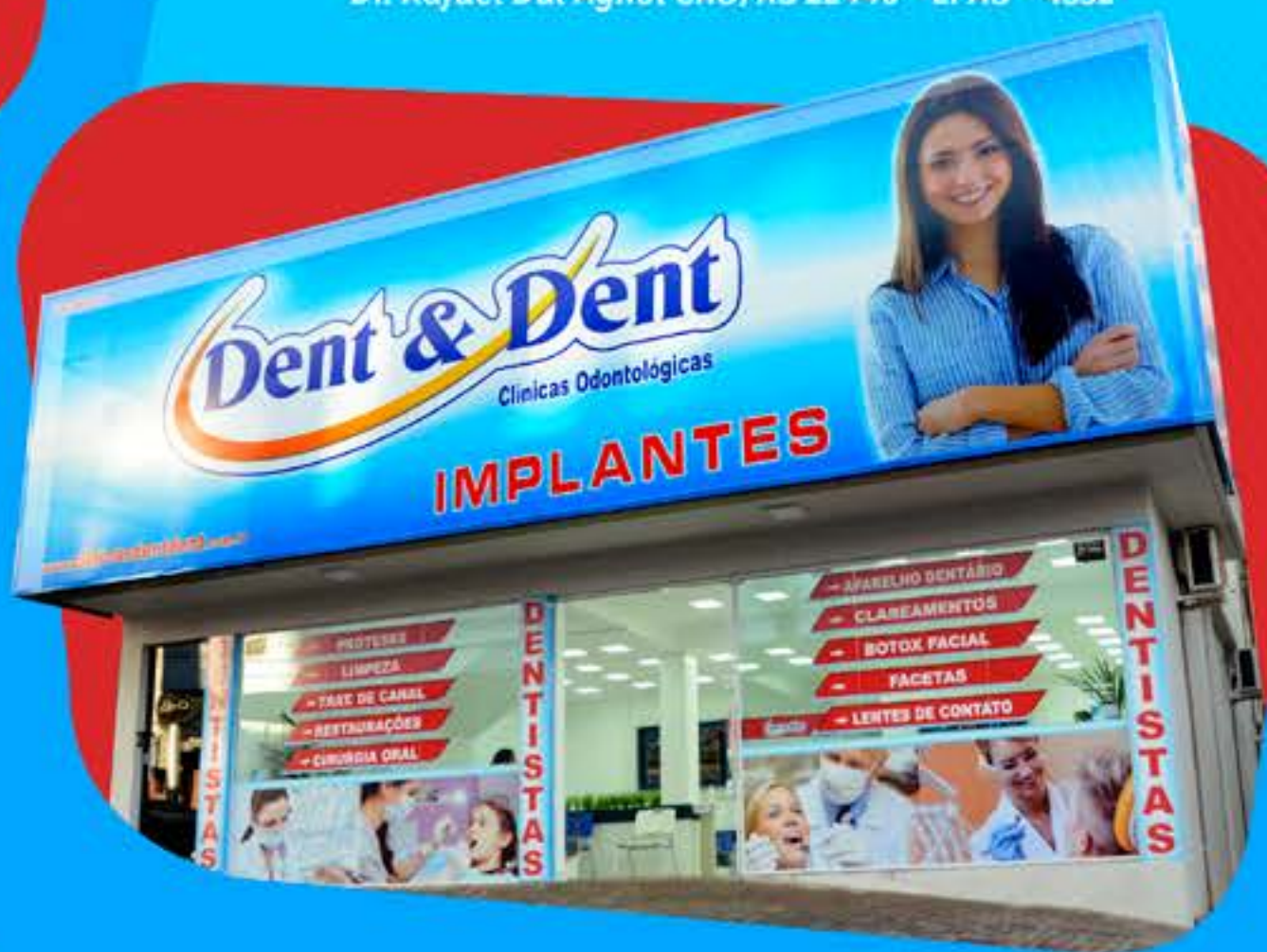
FAU ESTÚDIO DE CONTEÚDO