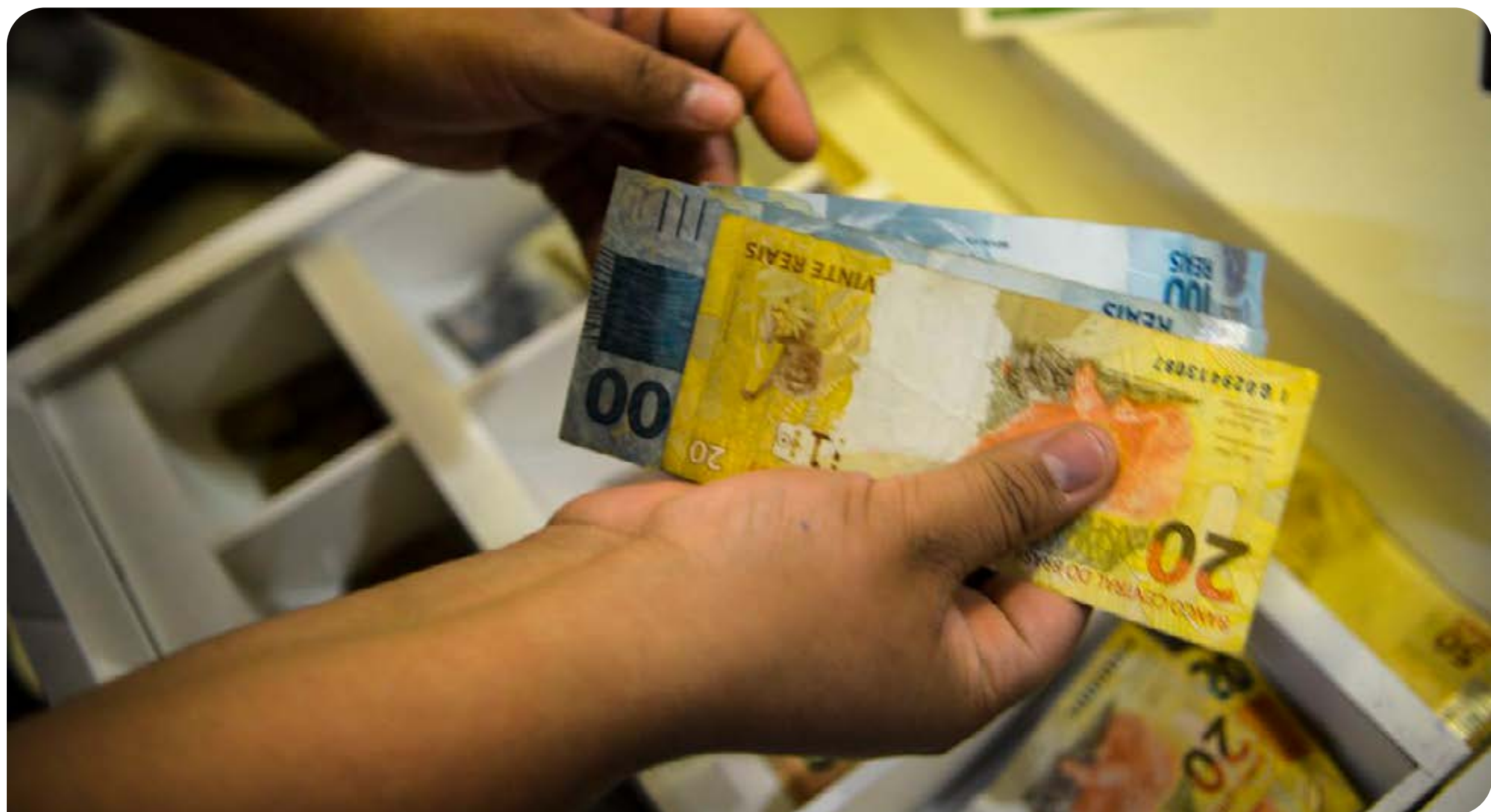
O valor mínimo da prestação será de R$ 100 para a pessoa física, de R$ 300 para a microempresa ou a empresa de pequeno porte, e de R$ 500 para pessoa jurídica

O Litígio Zero também prevê o fim dos recursos de ofício dentro do Carf para valores abaixo de R$ 15 milhões. Nesses casos, quando o contribuinte vencer em primeira instância, a Receita Federal deixará de recorrer, encerrando o litígio. De acordo com o Ministério da Fazenda, a medida extinguirá quase mil processos no Carf, no valor total de R$ 6 bilhões, e ajudará a desafogar o órgão para o julgamento de grandes dívidas.