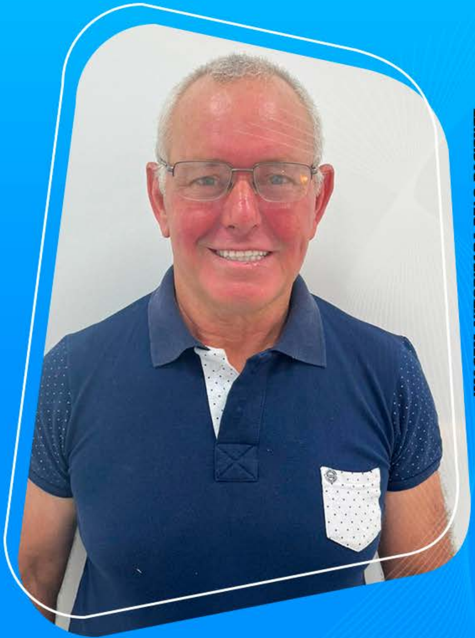
IMAGEM AUTORIZADA PELO PACIENTE.