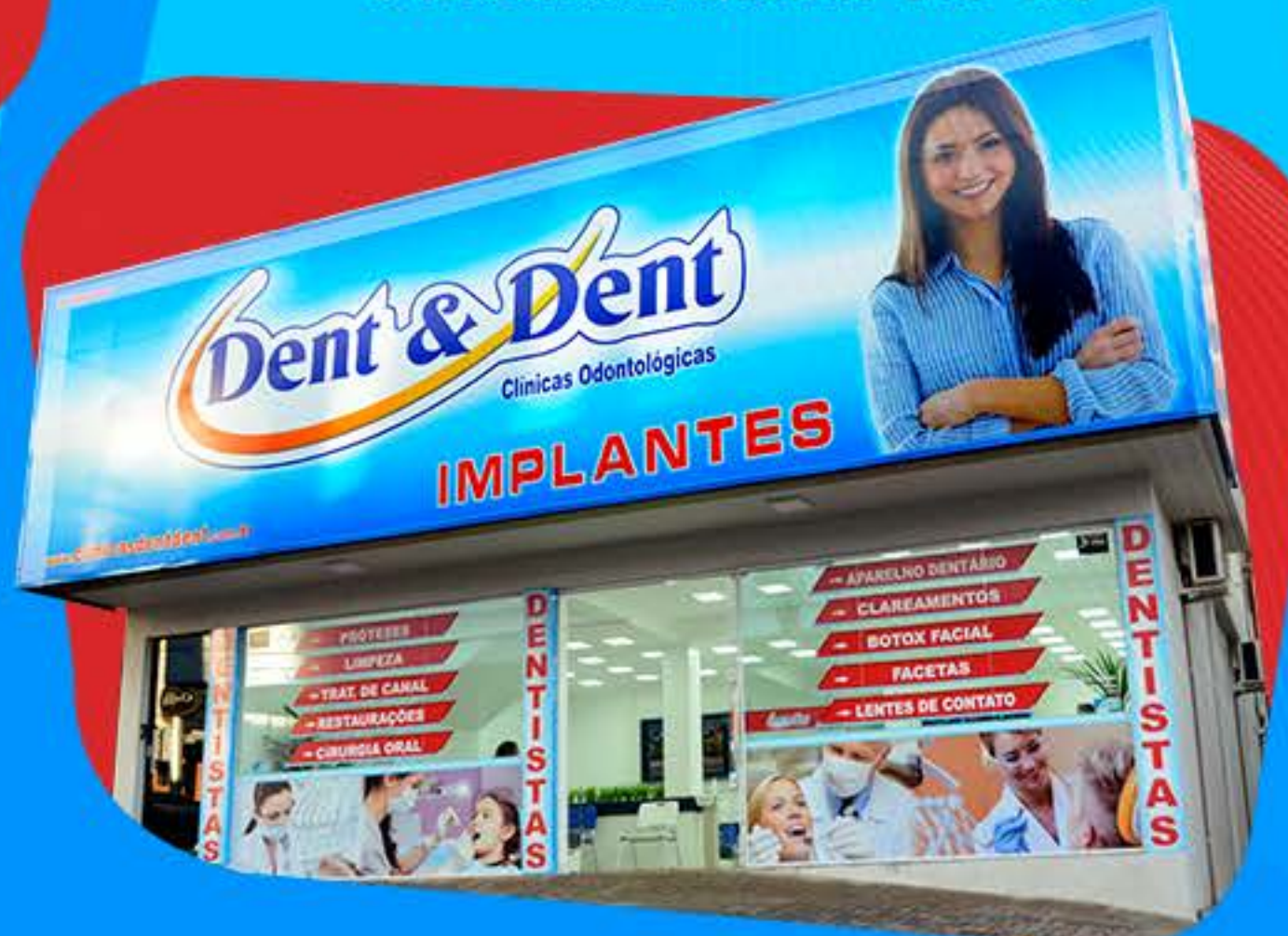
IMAGEM AUTORIZADA PELO PACIENTE.